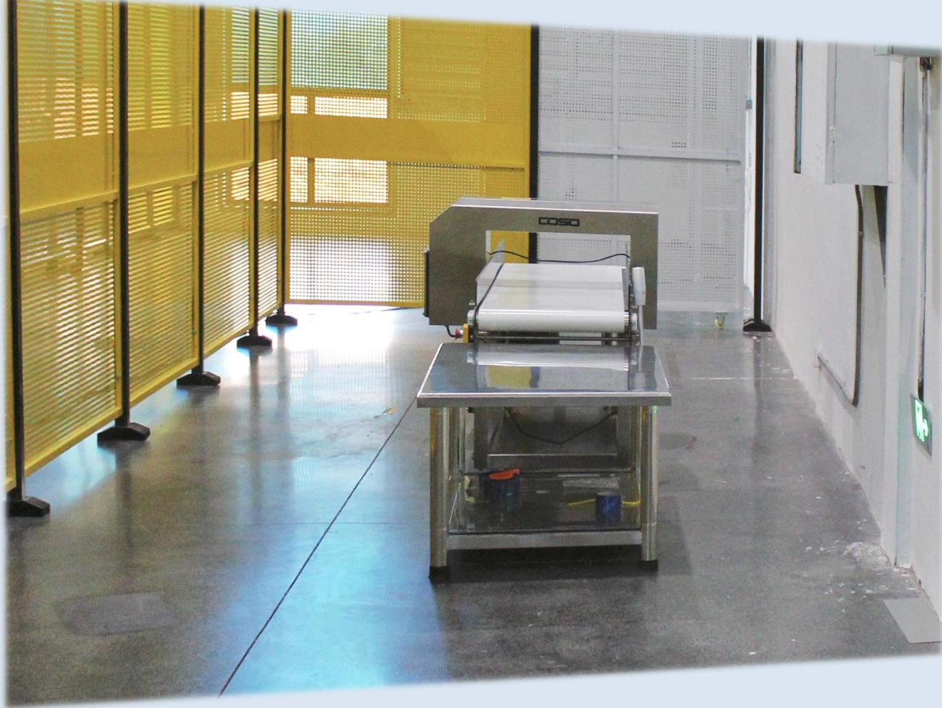
倉庫外装作業エリア