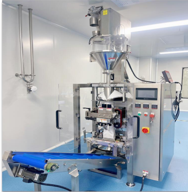
固形飲料包装機 能力: 約360袋/時間・1袋1kg