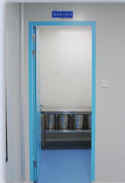
プレミックス原料室