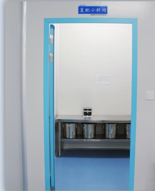
プレミックス原料室