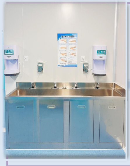
手洗い・乾燥エリア