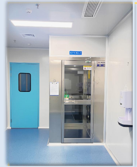
エアーシャワー室一 生産入口