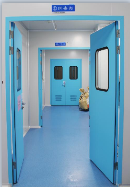
外装除去・消毒室